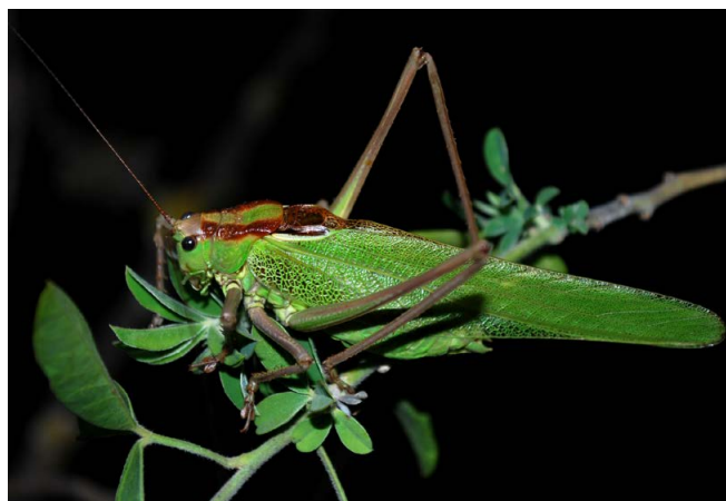
Calliphona ( Calliphona alluaudi )

Punto inicial- Starting point - Ausgangspunkt: Lugarejos