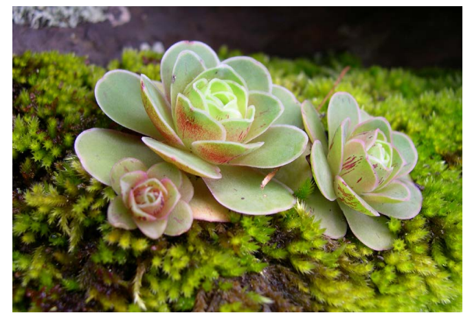
Talleta ( Aeonium aureum )

Lugarejos befindet sich zwischen zwei Staudämmen: Los Pérez und Lugarejos. Beide liegen auf der Landstrasse GC-217 die Cruz de Acusa und Fagajesto verbindet. Unsere Route beginnt am Weiler. Wir wenden uns Richtung Süd-Südosten nach Barranco de Luga- rejos-Artenara. Wir erreichen Hoya del Almendro. Dort verlassen wir die Betonpiste und wenden uns nach links, wo wir eine Rampe und die Stufen einiger Häuser hinaufsteigen. Anschliessend steigen wir den alten Weg bis zum asphaltierten Parkplatz von La Degollada hinab. An dieser Stelle beginnt der Abstieg nach Risco Caído. Dieser bequeme Wanderweg führt bis zum Mittelpunkt eines Bergrückens. Dort wenden wir uns nach rechts um die archäologische Fundstätte zu erreichen. Auf dem Rückweg wenden wir uns wieder zurück auf den Bergrücken. Dort steigen wir mehrere natürliche und auch aus Beton errichtete Stufen (die rutschig sein können) hinunter, bis wir das Flussbett der Schlucht und die asphaltierte Landstrasse, die auf der linken Seite liegt, erreichen. Sobald wir auf diese Strasse gelan- gen, wenden wir uns nach links um den Beginn des nächsten Weges zu finden. Holzschilder weisen auf der linken Seite darauf hin, die asphaltierte Strasse zu verlassen und in Richtung Andén de la Hu- erta zu steigen. Wir erreichen Paso de Los Pérez, wo wir einen wun- derbaren Blick auf die Staudämme werfen können. Dieser Weg führt direkt weiter bis nach Lugarejos, der Ausgangspunkt unserer Route.