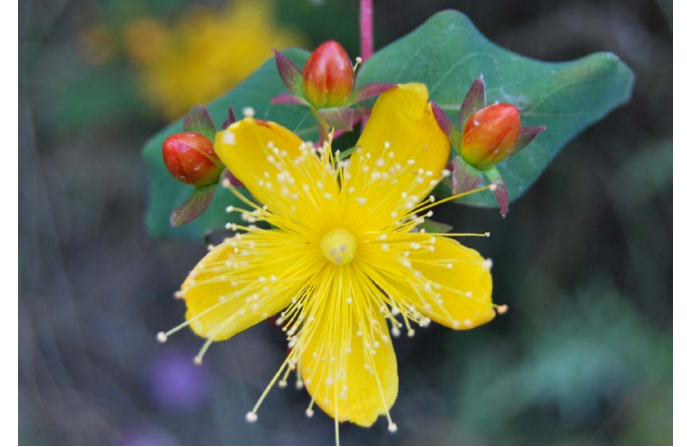
Malfurada ( Hypericum grandifolium )