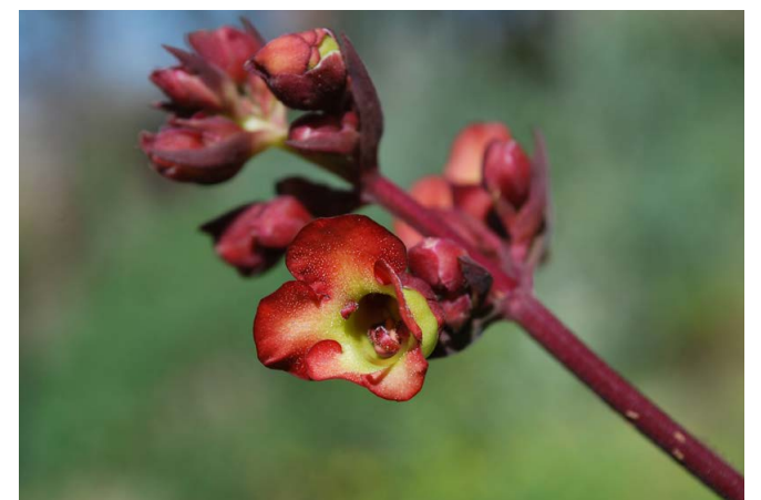
Fistulera ( Scrophularia calliantha )